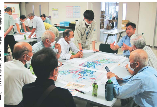
農業委員・推進委員が座談会をけん引